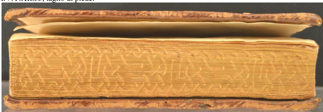
A.V.Y.XII.35, taglio di gola. Cfr. Piacenza, Collegio Alberoni, D.IV.A.27, Pietro Bembo, Petri Bembi card. Epistolarum familiarium, libri 6. Eiusdem, Leonis 10. pont. max. nomine scriptarum, lib. 16 , Venetiis, Gualtiero Scoto, 1552 (MACCHI 2012, Fig. 7).