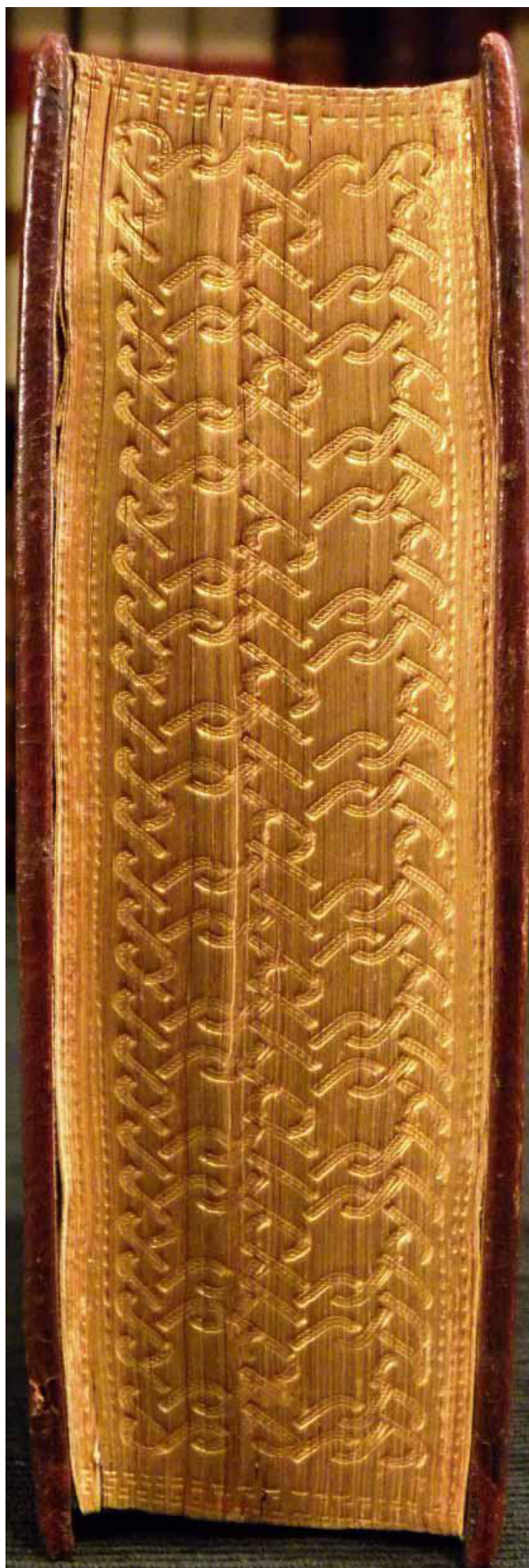
Piacenza, Collegio Alberoni, D.IV.A.27.