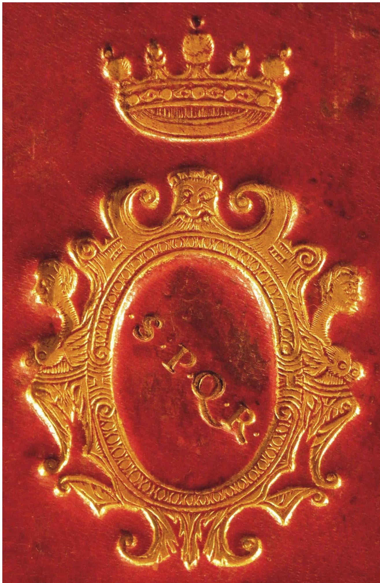
Piacenza, Collegio Alberoni, D.V.C.23, piatto posteriore, particolare.