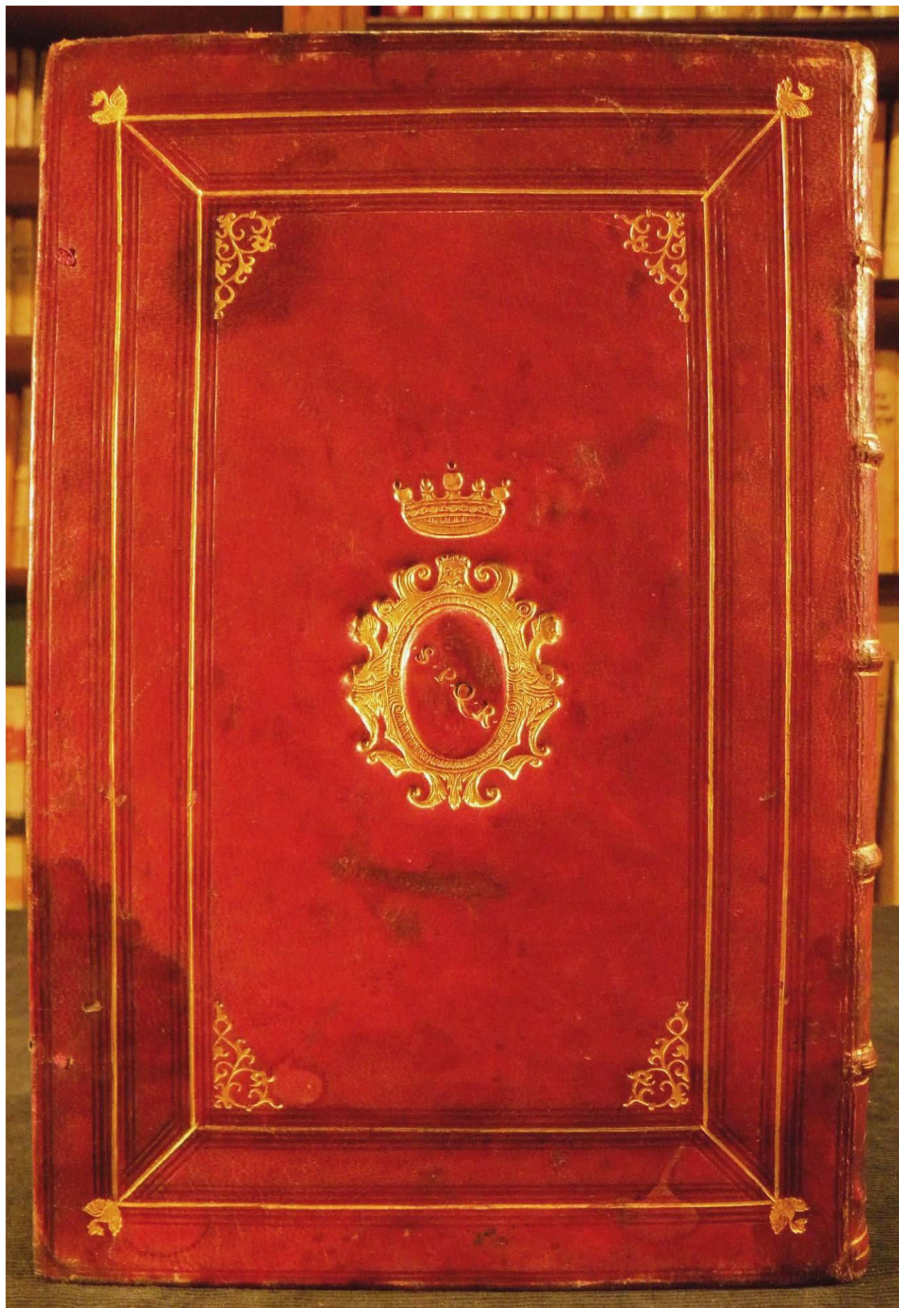
Piacenza, Collegio Alberoni, D.V.C.23, piatto posteriore.