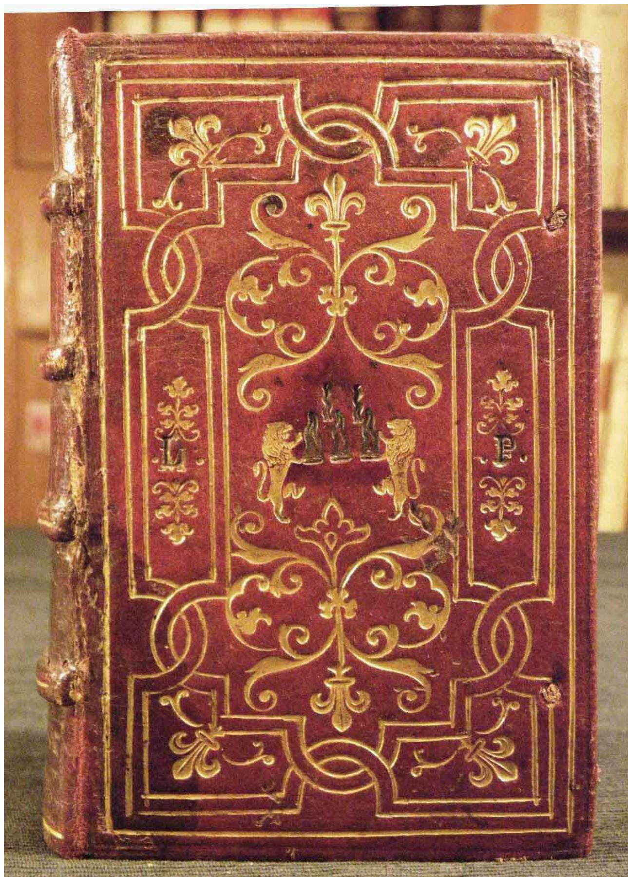
Piacenza, Collegio Alberoni, D.IV.A.27.