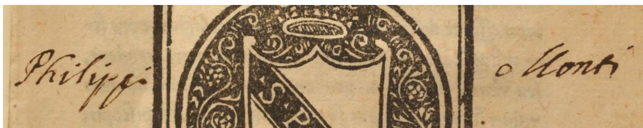
A.V.Y.XII.35, frontespizio, particolare.