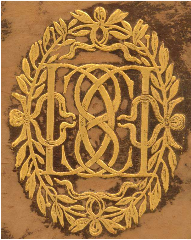
A.V.AA.XVI.7, piatto posteriore, particolare.