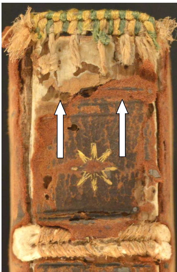
1 A.V.AA.XVI.7, particolare. Le frecce indicano le catenelle rilevate in testa al dorso.

Il materiale di copertura, capitelli a doppia anima 1 , le catenelle rilevate 1 , i numerosi nervi in relazione al formato, l'aletta in foggia di trapezio 2 e le note tipografiche propongono di assegnare la legatura alla seconda metà del XVI secolo, eseguita in Francia. In evidenza i supra libros riferibili a Denis de Sallo 3 applicati in epoca posteriore come suggerisce la diversa tonalità della doratura rispetto a quella circostante, gli arcaicizzanti nervi in pelle allumata di medievale memoria, gli estremi dell'opera inusitabilmente collocati al piede del dorso mentre compare di solito nel secondo scompartimento, i tagli dorati 4 e il frontespizio illustrato 5 . Testo réglé .