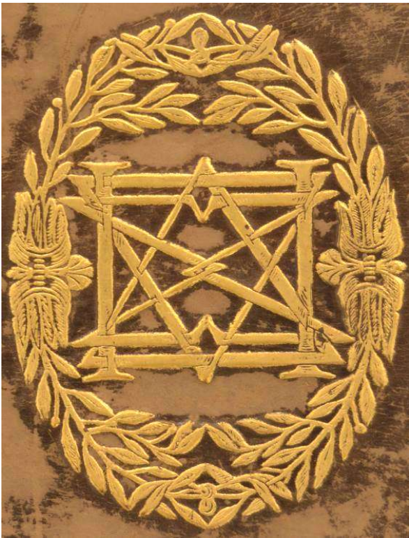
3 A.V.AA.XVI.7, piatto anteriore, particolare.