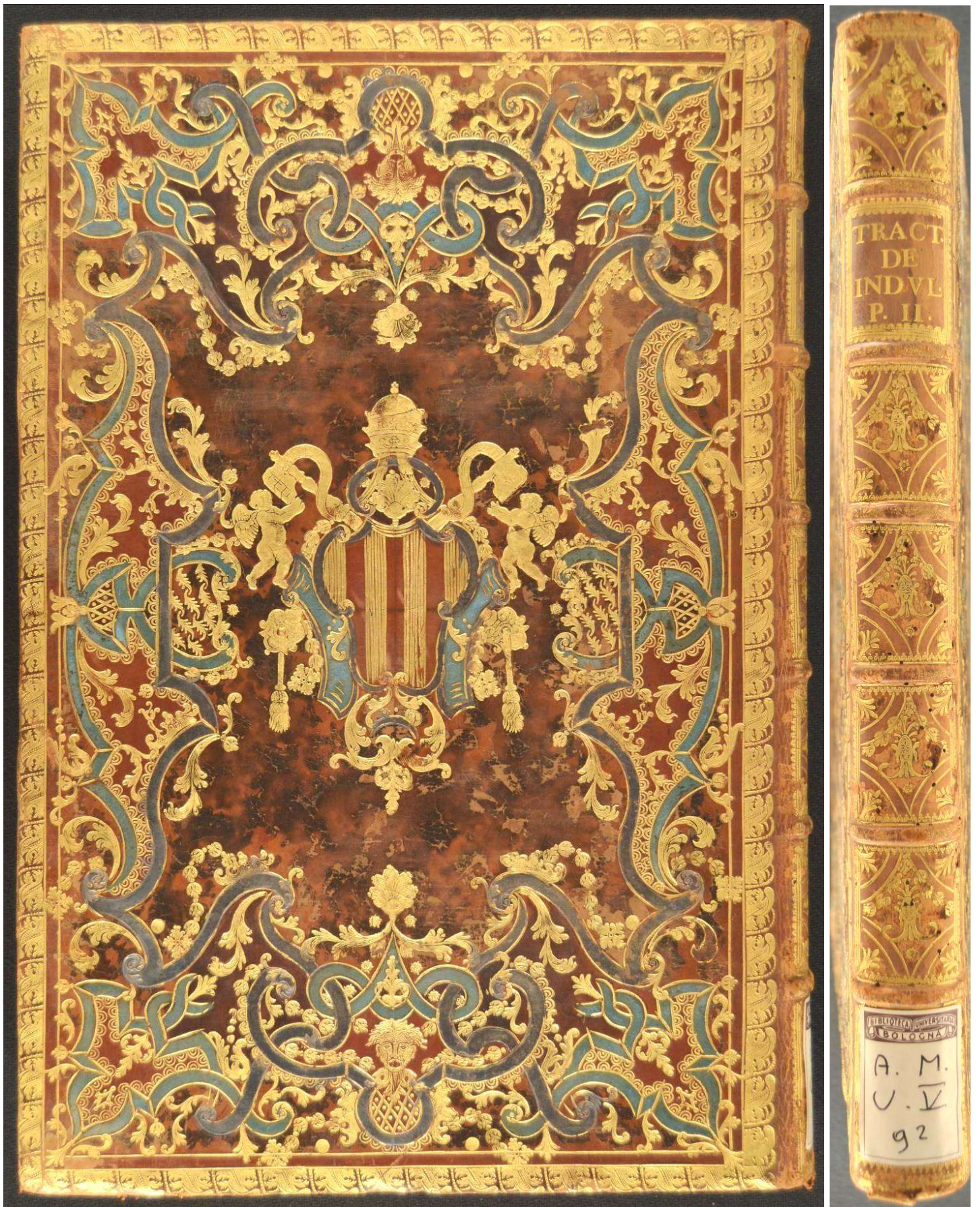
A.M.U.V.9, Teodoro : da Spirito Santo, Tractatus dogmatico-moralis de indulgentiis, in duas partes distributus in quarum prima post dissertationem prooemialem historicam de origine ... In secunda de indulgentiis in particulari, sive de indulgentiis localibus ... Pars prima [-secunda] ... Authore F. Theodoro a Spiritu Sancto .. , Romae : ex typographia Palladis, 1743, 371x240x36 mm.