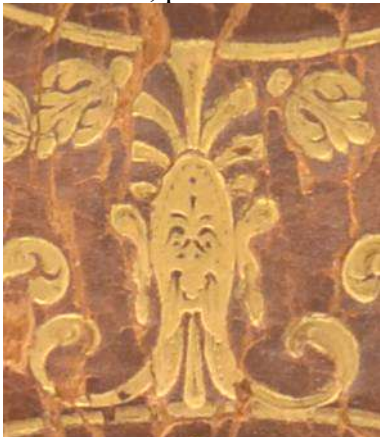
A.M.M.V.3-1, particolare. Cfr. anche MAGGS 1921, n. 347, tav. CVIII, Dictorum Factorumque memorabilium Libri IX , Lyon, 1613.