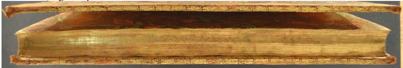
A.M.U.V.9, taglio di gola.