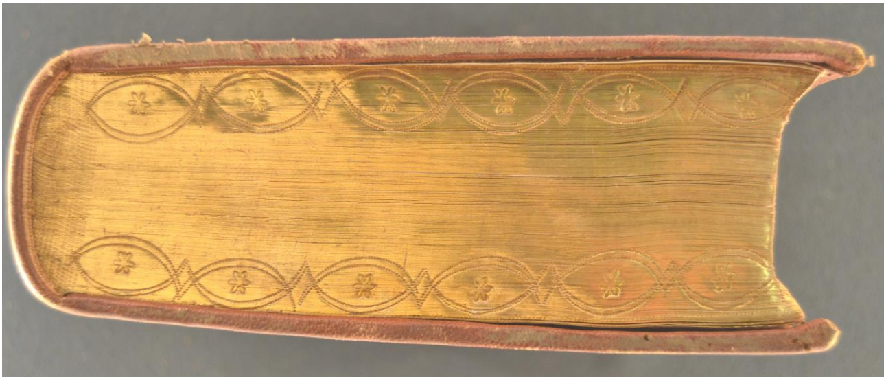
A.M.F.VII.10-1, contropiatto anteriore, particolare.