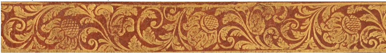
Bologna, Biblioteca civica dell'Archiginnasio, 3.T.II.39, particolare.