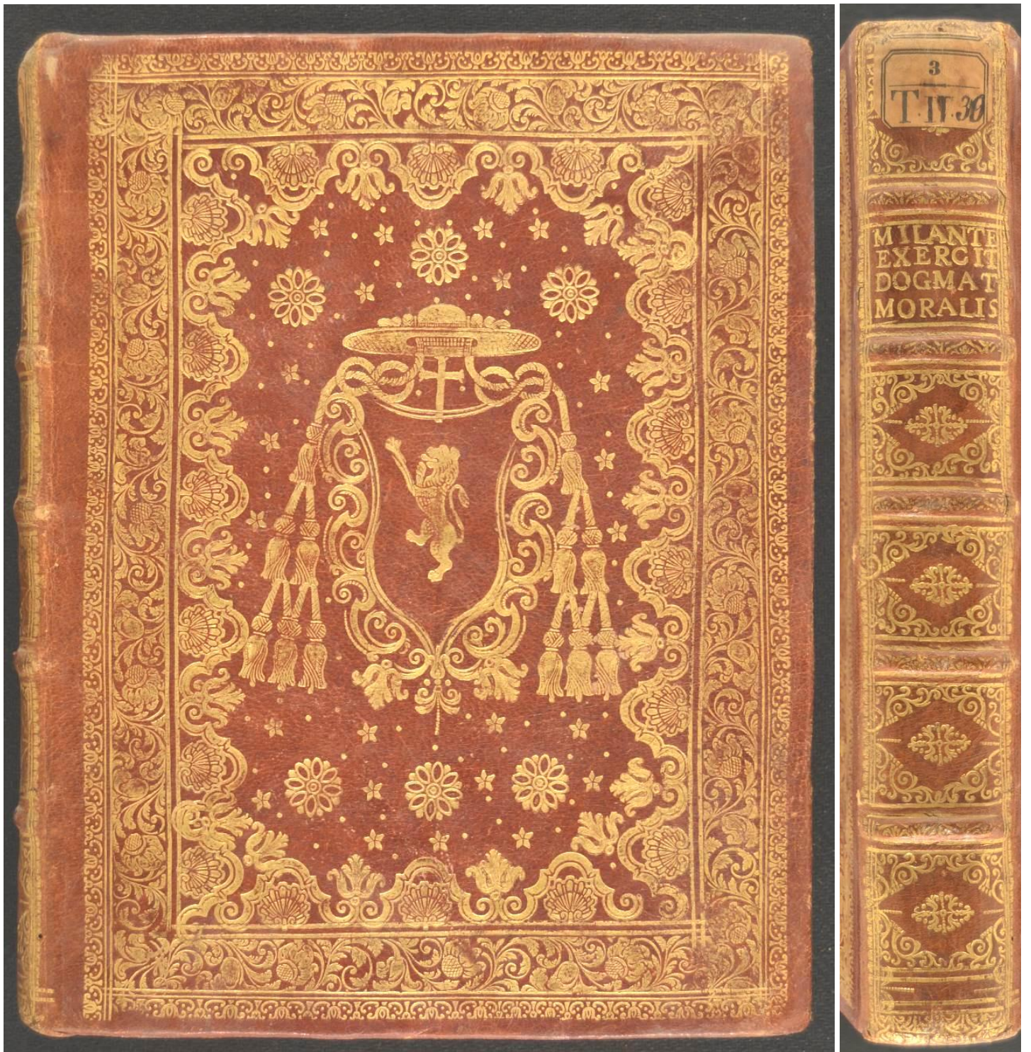
Bologna, Biblioteca civica dell'Archiginnasio, 3.T.II.39.