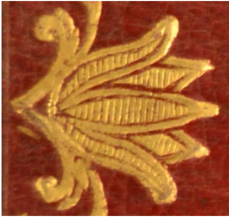
A.M.BB.III.51, particolare. Cfr. A.M.BB.III.51, A.M.F.IV.33, A.V.N.III.41.