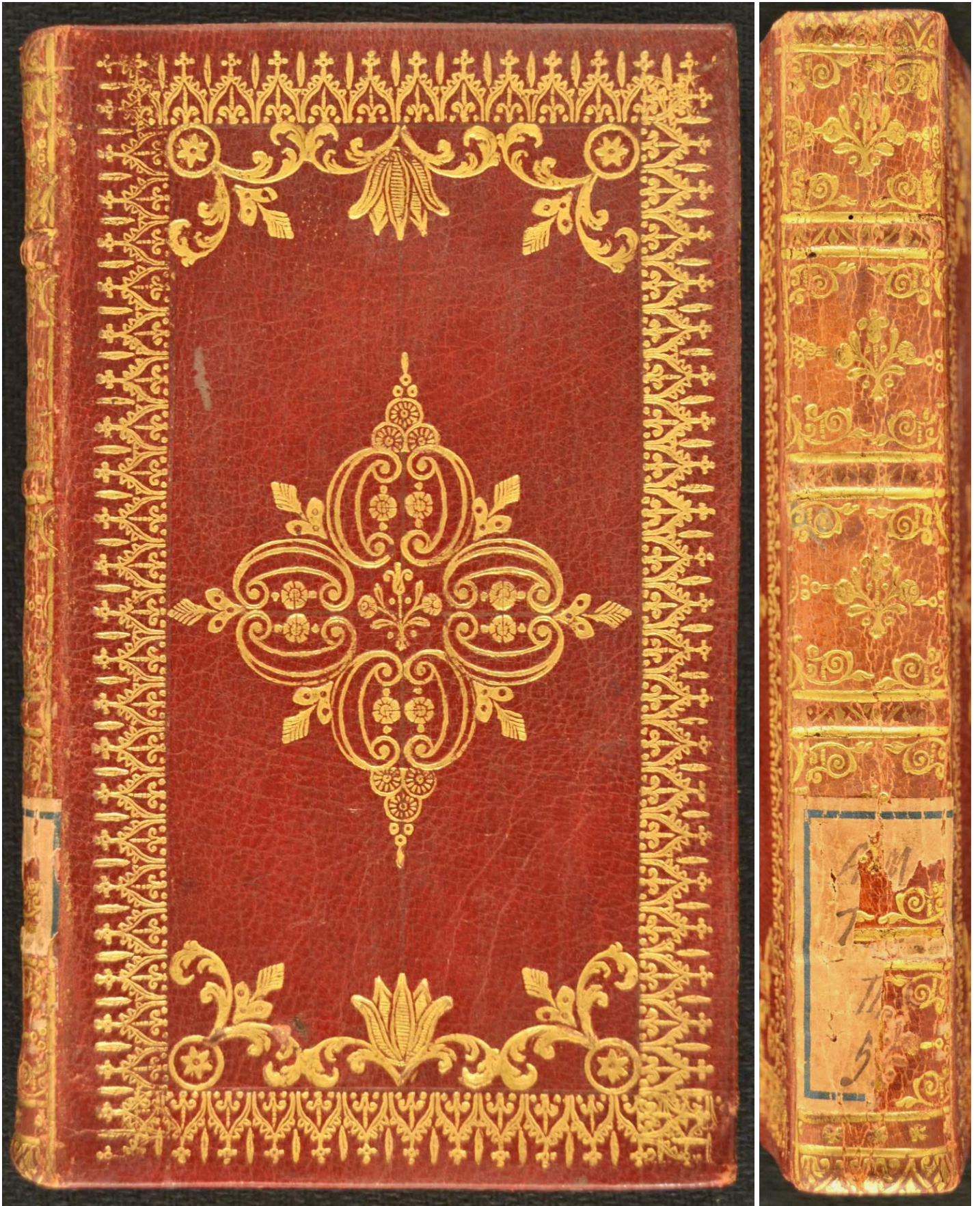
A.M.BB.III.51, Magagnotti, Pietro, Exercitationes literariae... , Patavii : Ex Typographia Seminarii, 1751, 145x82x13 mm.