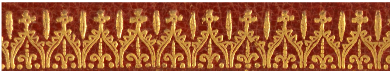
1 A.M.BB.III.51, particolare. Cfr. A.V.CC.VI.25, A.M.FF.V.29.

I fregi 1 , la probabile limitata diffusione del testo considerato l'autore e l'argomento del testo congiuntamente alle le note tipografiche inducono ad assegnare la legatura al terzo quarto del XVIII secolo eseguita a Padova. In evidenza i contropiatti rivestiti da lembo in tessuto 2 e i tagli dorati brillanti incisi 3 .