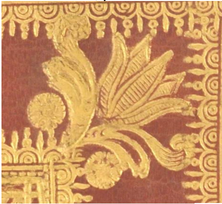
A.V.N.III.41, particolare. Cfr. A.M.BB.III.51, A.M.F.IV.33