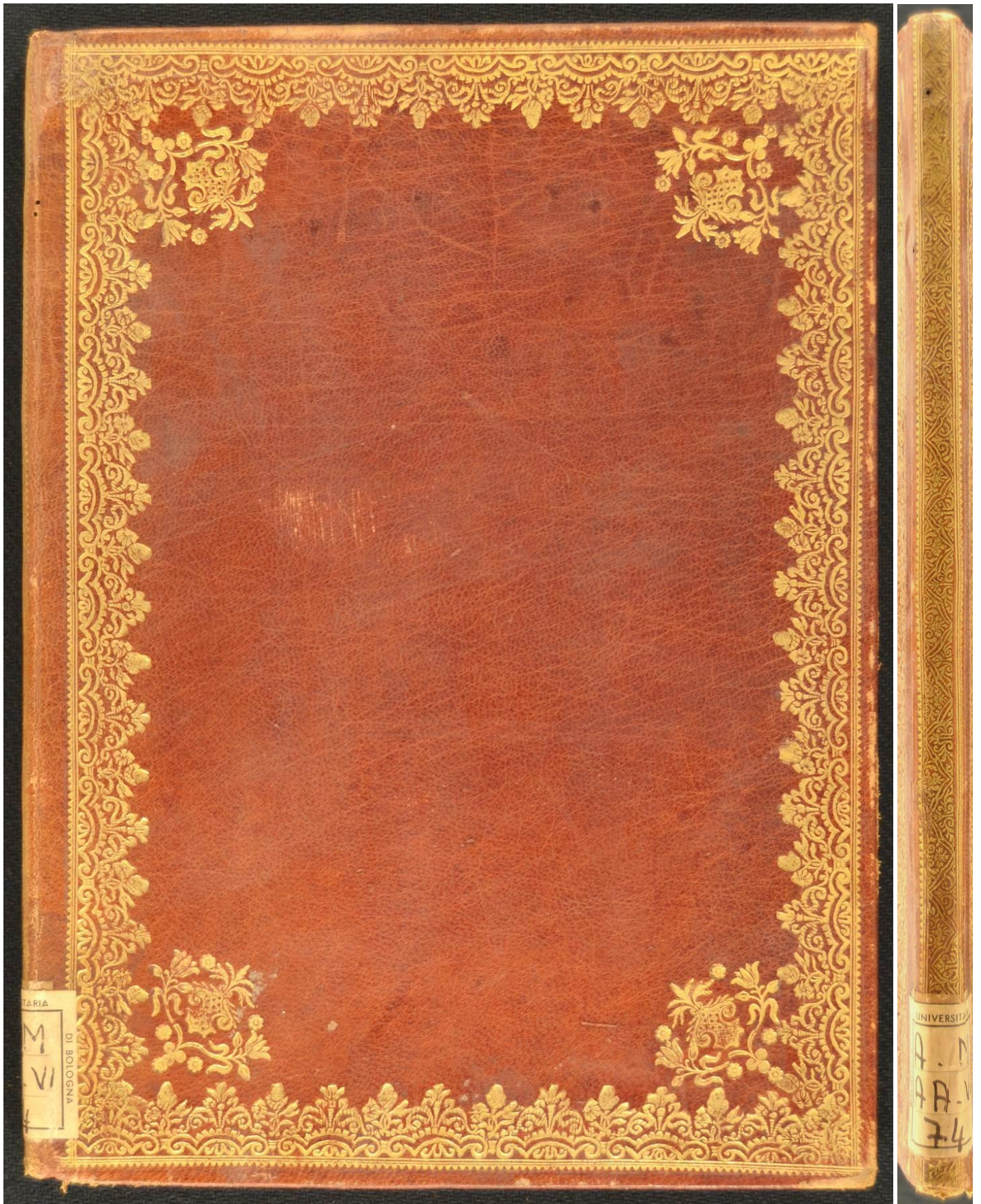
A.M.AA.VI.74, Formule facultatum: Pro Episcopis Americæ, et Indiarum Orientium..... (et alia) , s.l. s. d., 273x198x12 mm.