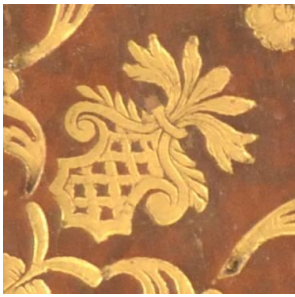
A.M.C.I.8 2, particolare.