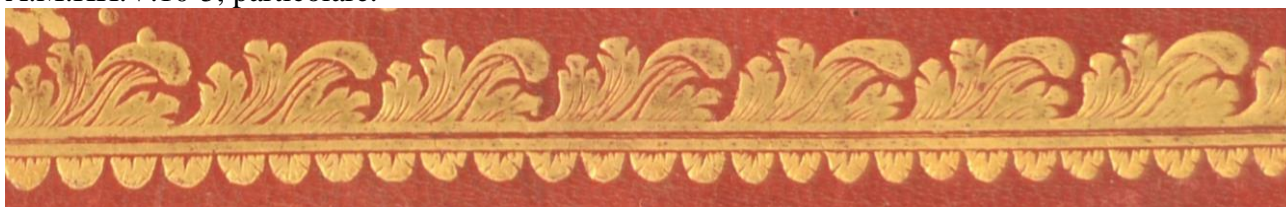
A.M.K.II.1 1, particolare.