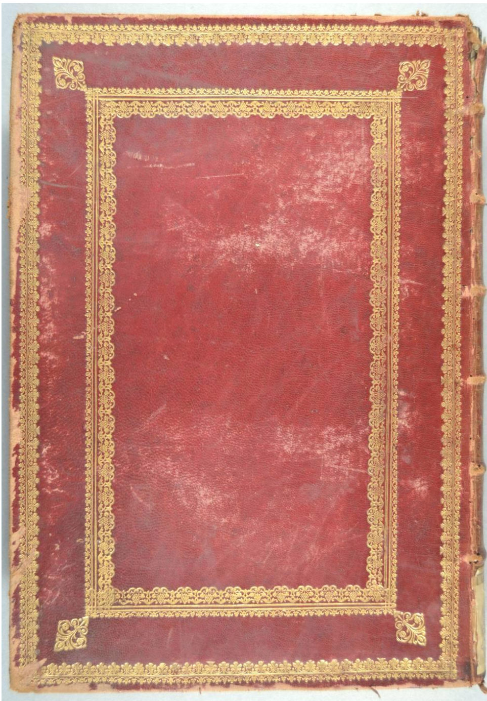
Modena, Biblioteca universitaria Estense, A.1.N.22.