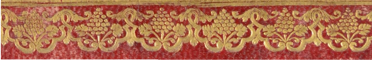
Modena, Biblioteca universitaria Estense, A.1.N.22, particolare.