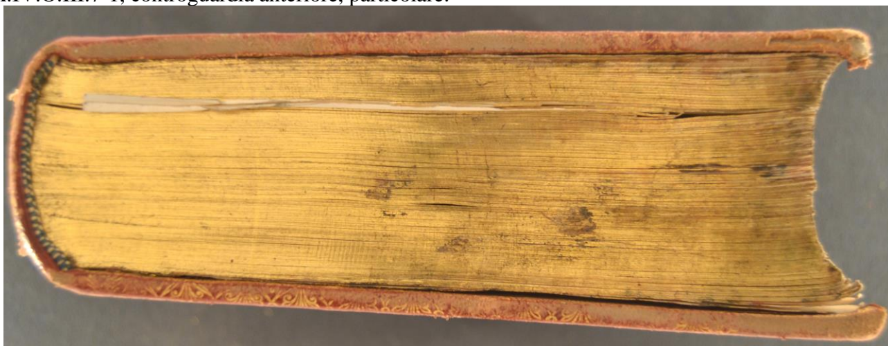
A.IV.O.III.7-1, controguardia anteriore, particolare.