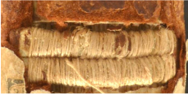
A.IV.D.XIII.29, contropiatto anteriore, innesto del laccio di testa, particolare.