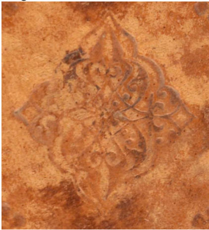
A.IV.D.XIII.29, particolare. Cfr. DE MARINIS 1960, II, n. 1813, tav. CCCXLIV, Venezia, Museo Correr, III.158, Commissione per Gentile Contarini , 1526.