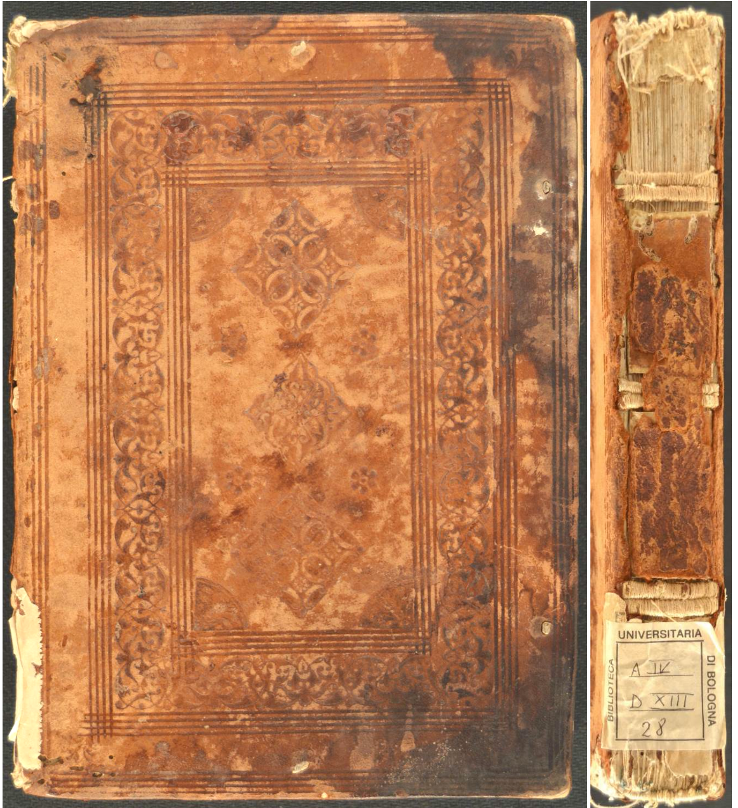
A.IV.D.XIII.29, Negri, Stefano <1498fl.>, Stephani Nigri Elegantissime è graeco authorum subditorum traslationes. uidelicet. Philostrati Icones. Pythagorae Carmen aureum Athenaei Collectanea Musonij philosophi Tyrij De principe optimo Isocratis de regis muneribus oratio & alia multa scitu digniss. & rara inuentu, quae uersa pagina lector bone lubens, & gaudens inuenies , (Impressum Mediolani : per Io. de Castelliono, 1521 mensis Augusti), 225x158x39 mm.