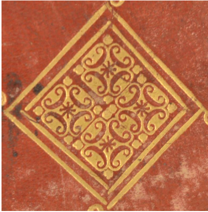
Bologna, Biblioteca civica dell'Archiginnasio, B 3229, particolare.