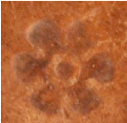
A.IV.D.XIII.29, particolare. Cfr. DE MARINIS 1960, II, n. 2020, tav. CCCLXVIII, Biblioteca Vaticana, l. d. m. 7, Terentius , Venezia, 1521.